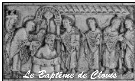
Le Baptême de Clovis

Ces rencontres sont animées par des prêtres et des laïcs de la paroisse.