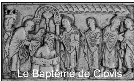
Le Baptême de Clovis

Ces rencontres sont animées par des prêtres et des laïcs de la paroisse.